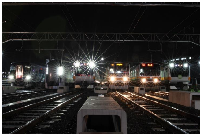
【前回の撮影会風景】