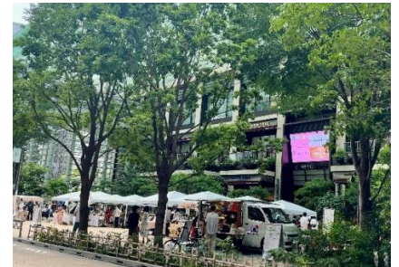
コレド室町テラスでのマルシェ実施イメージ