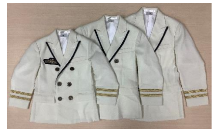
お子さま用駅長制服