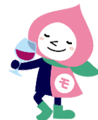
JRの山梨キャラクター 「ももすきん」