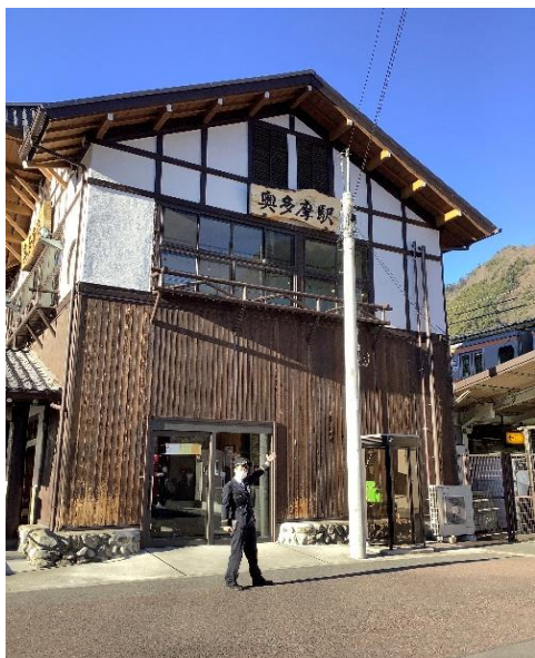
受付場所 奥多摩駅 改札外