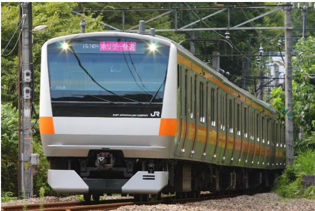
ホリデー快速おくたま号で使用している車両（E233系）