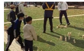
モルック体験イメージ

長さ20cmほどの木の棒（モルック）を投げて、計12本のピン（スキttl）を倒すスポーツで、幅広い年齢層で気軽に楽しめます。