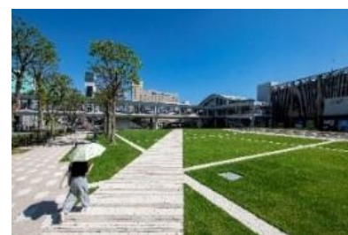
秋田駅西口駅前広場（芝生広場）