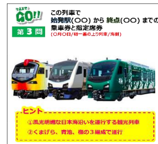
【マルスでGO! 問題(イメージ)】