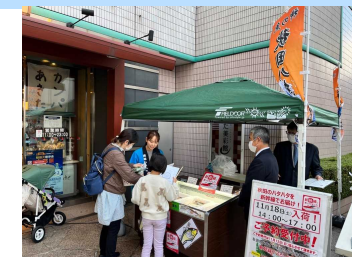
「はこビュン」で輸送したハタハタを東京のアンテナショップで販売