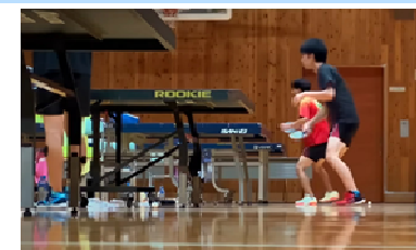
田沢湖スポーツセンターでのスポーツ合宿（早稲田大学卓球部）