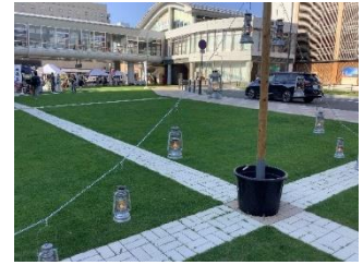
ランタンイメージ