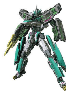
シンカリオンZ E5ヤマノテ