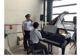
駅ピアノミニコンサートの様子

内容: 弘前市といえば「りんご」、弘前市物産協会によるりんごジュースを販売します。