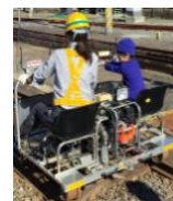
レールスクーター体験