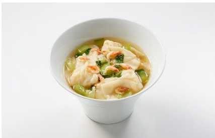
【メインメニュー】 大ぶりエビワンタン復興麵～桜海老を添えて～ ¥1,900(税込) (ミネラルウォーター付き)

定番の「大ぶりエビワンタン復興麵」に桜海老を添えたアレンジメニューに加え、豚の角煮をほろほろにほぐし、キノコ・甜面醬 てんめんじやん ・オイスターソースなどを合わせた特製肉味噌あん じやじやめん と平打ちの復興麵を和えて食べるオリジナルの炸醬麵、栃木県産黒毛和牛のもも肉とタケノコをあんかけ仕立てにしたカレーライス、丁寧に火入れをした厚みのある豚肩ロースにかつお節を衣のようにまぶしたちょっと贅沢なステーキを新メニューとしてご用意します。「サフィール踊り子 2号・3号」限定で提供する濃厚な甘みと爽やかな酸味のハーモニーが特徴の「マンゴーとナッツのカッサータ」とドリンクのセットもおすすめです。