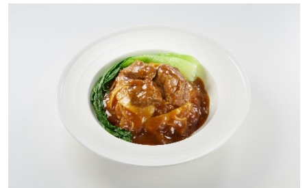
【メインメニュー】 美虎風黒毛和牛あんかけカレー ¥2,800(税込) (ミネラルウォーター付き)