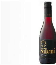
【ドリンクメニュー】 シレーニ・エステーツ セラー・セクション・ピノ・ノワール(375ml) ¥2,400(税込)

五十嵐美幸シェフがカフェテリアで提供するメニューと相性の良いワインをセレクトしました。軽やかな果実の香りと穏やかなタンニンのフレッシュかつ繊細な味わいが特徴の赤ワイン、シュールリー製法で醸した高い芳香性と酸でふくよかな味わいが特徴の白ワインの両方をご用意します。