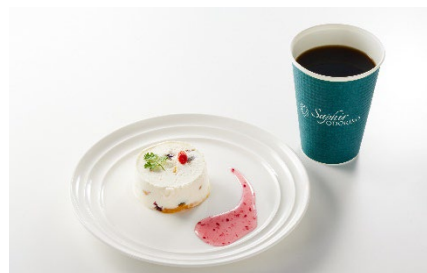
【サフィール踊り子 2号・3号限定メインメニュー】 マンゴーとナッツのカッサータとソフトドリンクセット ¥1,700(税込) マンゴーとナッツのカッサータとスパークリング ワインセット ¥2,350(税込)