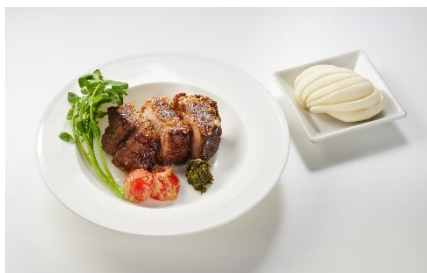
【メインメニュー】 極厚ポークステーキ～かつお節仕立て～ ¥3,000(税込) (中華風蒸しパン・ミネラルウォーター付き)