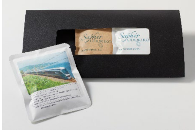
【オリジナルスーベニア】 「サフィール踊り子」オリジナル ドリップドコーヒー (3 パック入り) ¥900(税込)

新たに、お土産としてお持ち帰り可能な「オリジナルスーベニア」の販売を開始します。車内でも好評いただいているオリジナルの「ドリップコーヒー」と五十嵐美幸シェフ監修の「ティーバッグ～華美幸茶やまとうみ～」をご用意します。当日の車内販売にてご用意しておりますのでアテンダントへお気軽にお声掛けください。