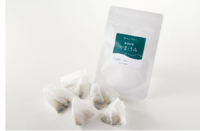
【オリジナルスーベニア】 「サフィール踊り子」オリジナル ティーバッグ ～華美幸茶やまとうみ～(5 パック入り) ¥1,800(税込)