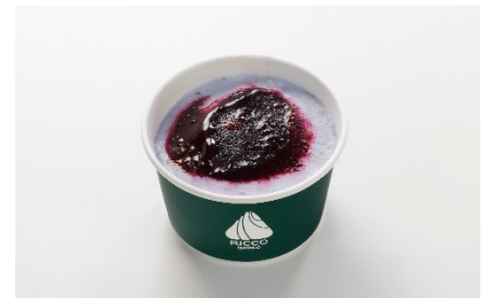
【サイドメニュー】 サフィールブルーアイス ¥680(税込)