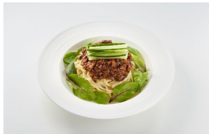
【メインメニュー】 特製肉味噌炸醬麵 ¥2,000(税込) (ミネラルウォーター付き)