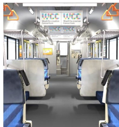
再現された E217系車両のデジタル空間 (イメージ)