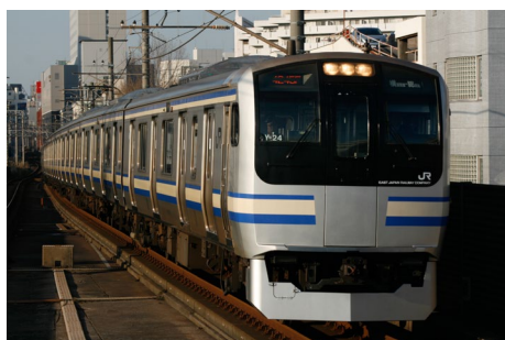
横須賀・総武快速線 E217系

( https://news.kddi.com/kddi/corporate/newsrelease/2023/10/24/7034.html )