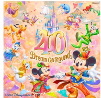
東京ディズニーリゾート 40 周年 “ドリームゴーラウンド”

2024年3月31日(日)まで開催中のアニバーサリーイベント「東京ディズニーリゾート 40 周年“ドリームゴーラウンド”」がいよいよグランドフィナーレを迎えます。ゲスト、キャスト、そしてディズニーの仲間たちの夢がひとつに繋がり、みんなでお祝いしてきた特別な1年。“夢がかなう場所”東京ディズニーリゾート 40 周年のグランドフィナーレをみんなと一緒に祝いましょう！