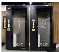
▲ STATION BOOTH