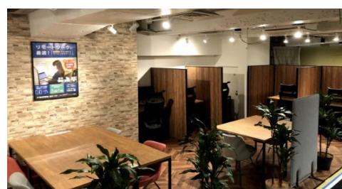
コインスペース グランデュオ蒲田店[西館 M2 階]