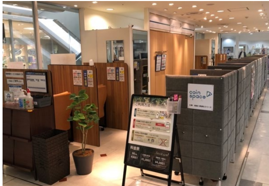
コインスペース 水戸エクセル店