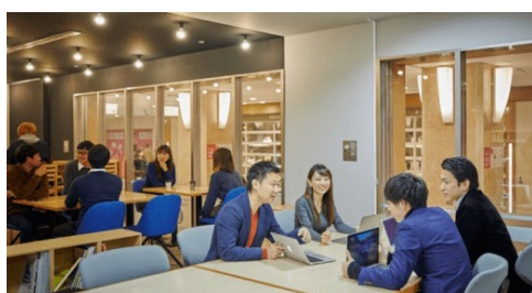
コインスペース 渋谷マークシティ店

※3 STATION WORK 専用 WEB サイトの予約ページに記載がございますのでご確認ください。