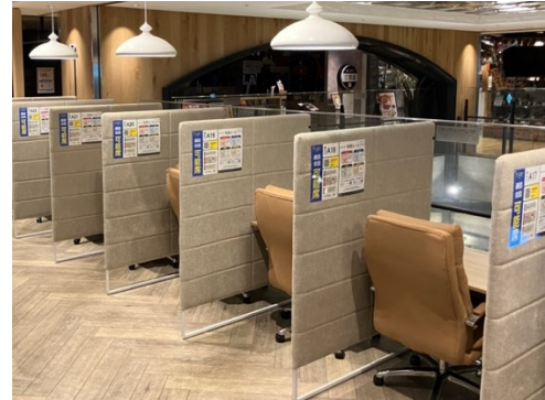
コインスペース 三宮オーパ2店