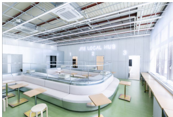
地方創生型ワークプレイス【JRE Local Hub 燕三条】