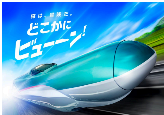
旅行サービス【どこかにビューーン!】