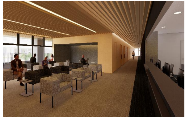
新たな人間ドックセンター待合 イメージ