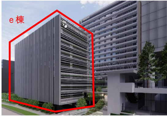
JR 東京総合病院 建替え等完成時の外観 イメージ