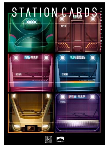
<オリジナルコレクション台紙>