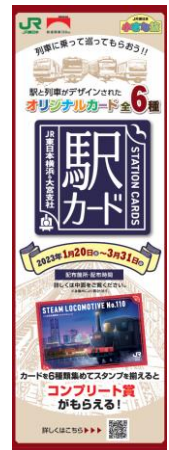
<パンフレットデザイン>