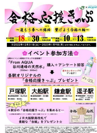
イベントポスター

また、4駅すべての「合格応援きっぷ」を集めて、「合格への線路(みち)カード」と一緒にJR大船駅にお持ちいただくと、4駅の「合格応援きっぷ」が収納できる「台紙」を差し上げます。