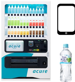
アキュア自販機と「From AQUA」

①専用のアキュア自販機で「From AQUA」を購入し、自販機に記載された二次元コードよりアンケートに回答します。