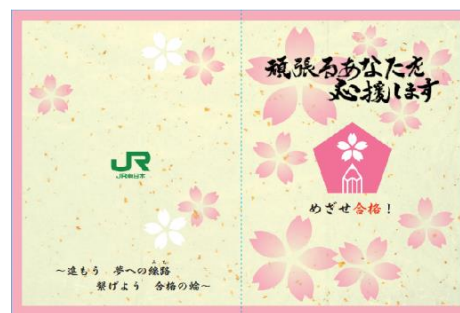
4駅すべての「合格応援きっぷ」が収納できる「台紙」