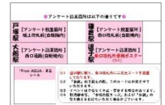
「合格への線路(みち)カード」

上記①～③を実施いただいたのち、他の3駅にて「合格応援きっぷ」を受け取っていただくには、各駅に設置している専用のアキュア自販機に記載された二次元コードよりアンケートに回答し、アンケート回答画面と「合格への線路(みち)カード」をイベント開催駅の各駅指定の改札窓口の駅社員に提示いただく必要があります。