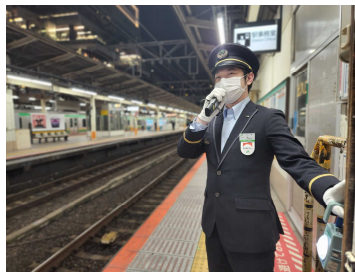
放送体験イメージ(ホーム上)