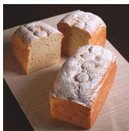
〈柏市〉 ベーカリーハレビノ 「幸せのバナナパン」