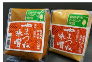
〈我孫子市〉 味噌 「やまつね味噌」