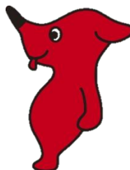
千葉県許諾第 A2691-1 号