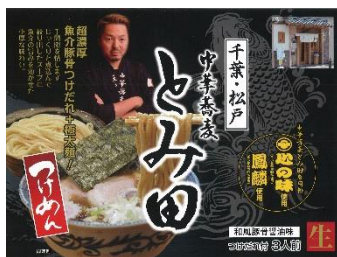
〈松戸市〉つけ麺とみ田 「つけ麺3食セット」