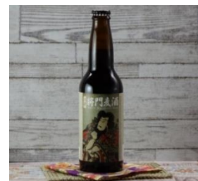
〈柏市〉クラフトビール 「将門麦酒」