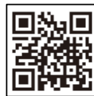
駅からハイキング ホームページ