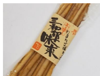
〈取手市〉 漬物 「サワト ごぼう漬け」