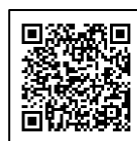
「のもの産直市」 LINE 公式アカウント

※プレゼントやショップカードの詳細については LINE 公式アカウント内の注意事項をご確認ください。