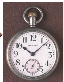
初代国産鉄道時計