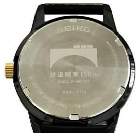
裏ぶたイメージ (シリアルナンバー刻印)