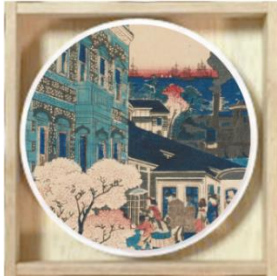
新橋駅版豆皿(旧新橋駅)