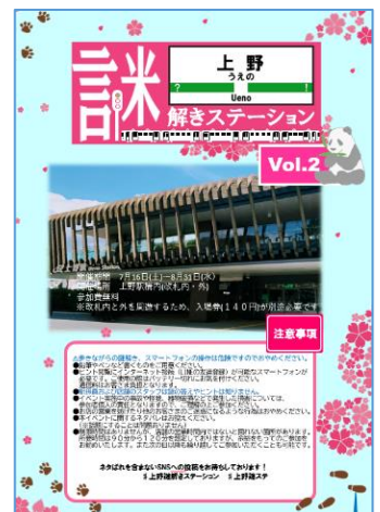
パンフレットイメージ