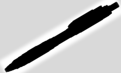
「上野謎解きステーション」 オリジナルグッズ

全ての謎を解いた後に、アンケートにお答えいただくと、もれなく「上野謎解きステーション」オリジナルグッズを差し上げます！ ※賞品は無くなり次第配付終了となりますので、あらかじめご了承ください。