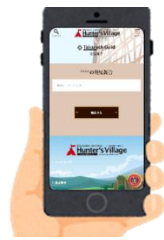
キーワード入力 Web(イメージ)