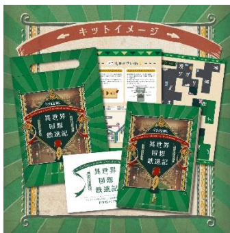
謎解きキット(イメージ)