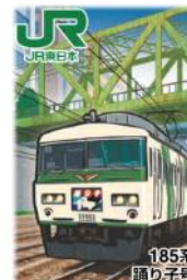
【185系踊り子号デザイン】(イメージ)