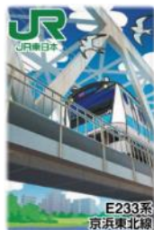
【京浜東北線E233系デザイン】(イメージ)