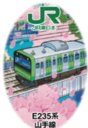
【山手線E235系デザイン】(イメージ)