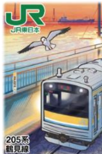
【川崎エリアデザイン】(イメージ)