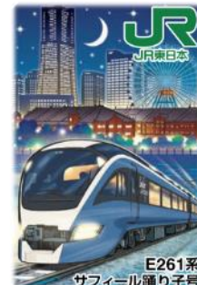
【横浜エリアデザイン】(イメージ)