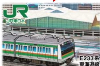
【品川エリアデザイン】(イメージ)