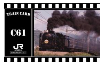
オリジナル列車カード