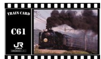
オリジナル列車カード