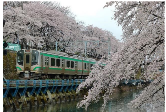
霞城公園（イメージ）