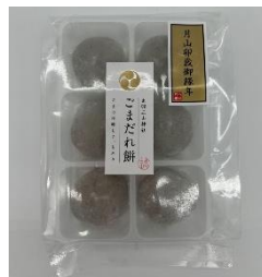
「出羽三山ごまだれ餅」 (有)達商

「西の明石、東の志津川」と呼ばれる南三陸志津川湾のタコは、アワビを食べて育つと言われ昔から一級品としてギフトや一部の高級料亭に出回るだけの大変貴重なタコです。知る人ぞ知る南三陸志津川湾産のタコをぜひ味わってください。