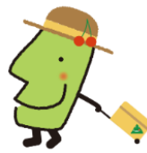
山形県PRキャラクター 「きてけろくん」