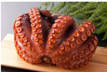
「タコ商品各種」 山内鮮魚店

「西の明石、東の志津川」と呼ばれる南三陸志津川湾のタコは、アワビを食べて育つと言われ昔から一級品としてギフトや一部の高級料亭に出回るだけの大変貴重なタコです。知る人ぞ知る南三陸志津川湾産のタコをぜひ味わってください。