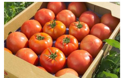
「サンシャイントマト」 (株)ワンダーファーム

山形県鶴岡市にある、出羽三山神社で伝わる精進料理にも使われる胡麻を使用。とろーりごまだれを中に入れた一口サイズのお餅です。