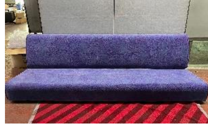
485系やまどり ロングシート