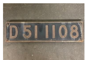
SL銘板 D51 1108