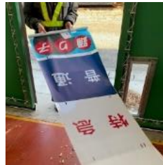
愛称表示幕 幕のみ