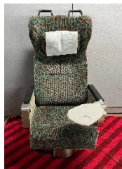
485系やまどり 1人掛け客室座席・テーブルセット

出品商品 485系やまどり1人掛け客室座席・テーブルセット、愛称表示幕、185系オルゴール、SL銘板(D51 1108)など