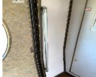
485系やまどり 客室ドア側面手すり