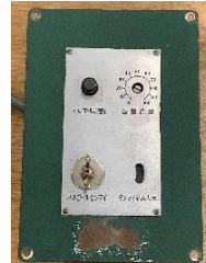
185系オルゴール 配線無し