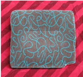
485系やまどり 座席マット

販売商品 485系やまどり座席マット、客室ドア側面手すり、ロングシート、205系方向幕など ※商品の購入はお一人さま1点限りとさせていただきます。