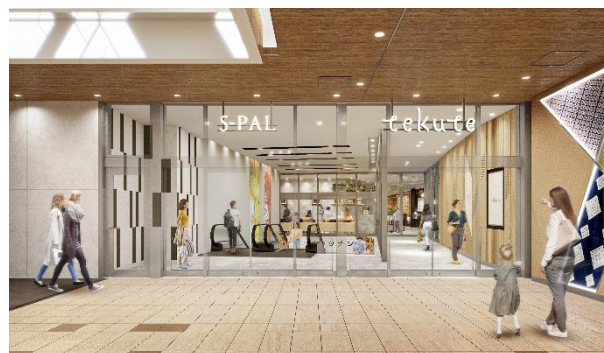
南側エントランスイメージ