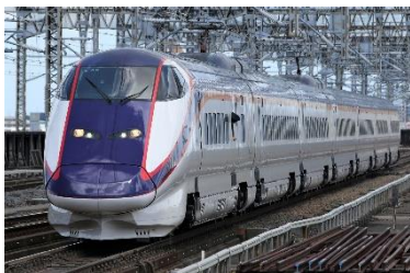
E3系「つばさ」現行カラー