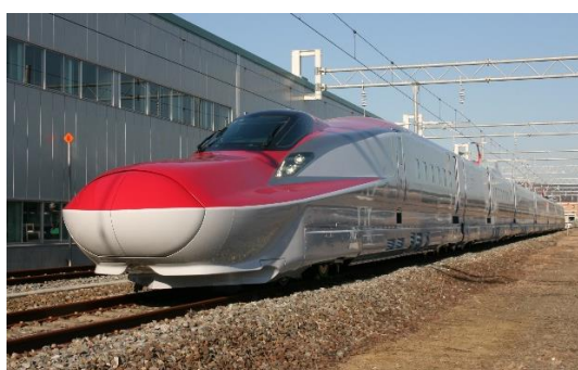
撮影イメージ（写真はE6系）