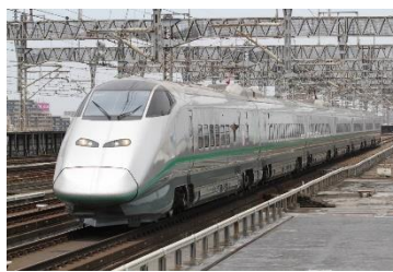
E3系「つばさ」シルバーカラー