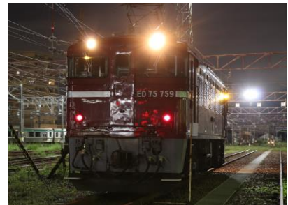
ED75 形交流電気機関車

(3) 内 容 ED75 形交流電気機関車を 3 両横並びに留置した状態での撮影会