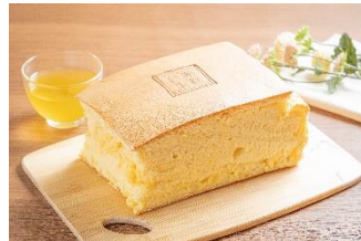
『台湾カステラ』 台楽タンガオ

ふわふわ食感が口に入ると溶けてしまうような香り高い、台湾の昔ながらのカステラケーキです。台湾で修業した職人が作り出す本場の味をお楽しみください。