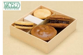
『揚最中&南蛮焼』 中里

明治 6 年創業の老舗和菓子店。北海道十勝産の小豆で練り上げたおぐら餡を挟んだ「揚最中」と、黒糖の風味豊かな「南蛮焼」の詰め合わせを出来たてでお届けします。