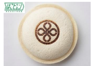
『ポケットサンド ヒレかつ・卵』 とんかつまい泉

1965 年創業、東京・青山のとんかつ専門店。自慢のヒレかつと、甘めのとんかつソース、とろーりとした卵をはさみこんだ、丸い形のサンドイッチです。