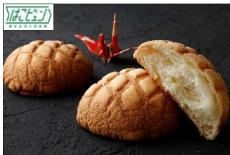
『ジャンボめろんぱん』 花月堂

浅草名物の「ジャンボめろんぱん」。外はサクサク、中はふんわりメロンパンです。朝に焼いた商品を新幹線でお届けします。