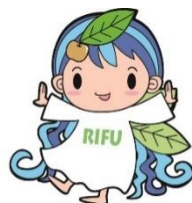
利府町観光イメージキャラクター 「十符の里の妖精 リーフちゃん」