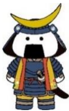
仙台・宮城観光PRキャラクター 「むすび丸」