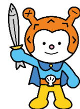
気仙沼市観光キャラクター 「海の子 ホヤぼーや」