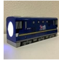
貨物列車懐中電灯