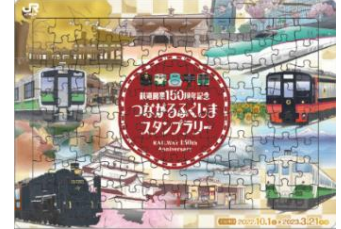
オリジナルジグソーパズル イメージ

※オリジナル賞品の配付箇所は、「駅スタンプ」リニューアル対象駅となりますが、福島駅は「西口改札口」、郡山駅は「2階新幹線中央改札口」、会津若松駅は「改札口」、それ以外の駅は「窓口」での配付となります。