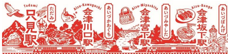
「駅スタンプ」イメージ