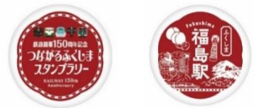
オリジナル缶バッジ イメージ

(2) 対象の「駅スタンプ」すべてを集めた先着合計 150 名様にはオリジナルジグソーパズルをプレゼントします。