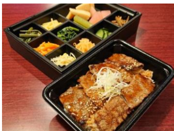
山形牛焼肉二段重弁当