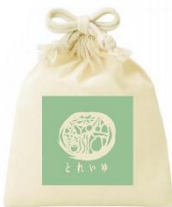
オリジナルアメニティ袋