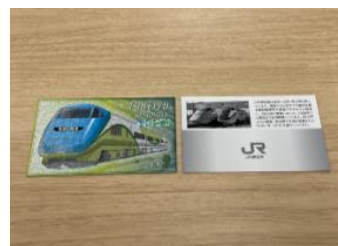
「とれいゆ つばさ」カードイメージ

ご宿泊いただいた方の中から先着で100名様に、「とれいゆ つばさ」カードをプレゼントいたします。