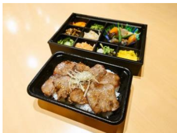
焼肉屋の特選牛塩タン重弁当