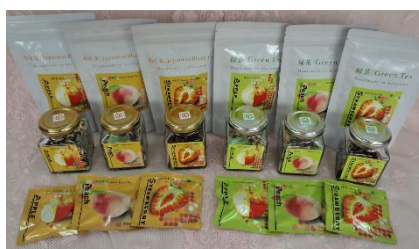
『緑茶・和紅茶くだもの各種』

創業明治25年の喜多方江川米菓店と地元で愛される味「塩川屋」との共同開発商品。会津米を100%使用した懐かしい味の本格ソースせんべいです。