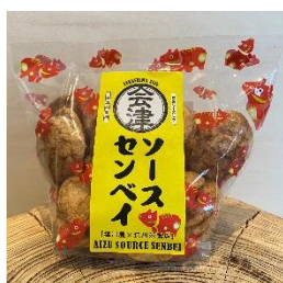
『会津ソースせんべい』