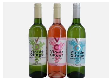
『Vin de Ollage 各種』

国産茶葉と福島県産くだものをブレンドした緑茶と和紅茶です。無添加・無香料、甘味料も使用せず果物本来の甘みを楽しめ、体に優しい風味と茶葉の芳醇さを感じる商品です。