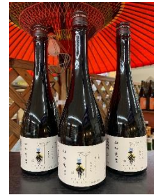
『純米大吟醸山川光男 2022 なつ』

3種の糖類・10種のスパイス・2種の柑橘をブレンドし、3日間熟成させた無添加オーガニッククラフトコーラです。スパイスの芳醇な香り、キレの良い甘さ、柑橘の爽快感をお楽しみ頂けます