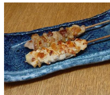
『やまがた地鶏 串焼き二種盛り合わせ』 上野駅 「のもの居酒屋かよひ路」他