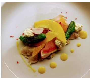
『むね肉の自家製ハムと リコッタチーズのサラダ 仕立て』 東京駅「TO 今日 BAR」