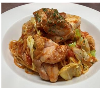
『やまがた地鶏とキャベツ のアラビアータ』 上野駅「ブラボー」