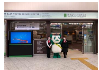
駅たびコンシェルジュ上野

③内容 山形産直市でお買い物した際のレシートをご提示すると山形県の産品が当たる抽選会にご参加いただけます。また、「やまがたへの旅【山形県】」のInstagramをフォローしてくれた方、または既にフォローしている方は、もう1回抽選会に参加が可能となります。