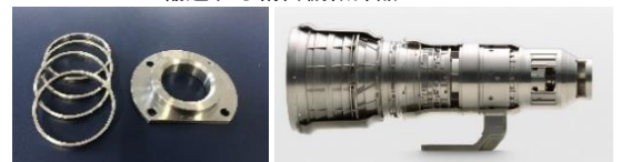
コンプレッサーの精密部品