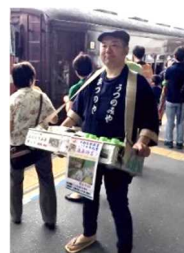
駅弁立ち売り再現