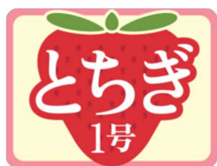
特急「とちぎ1号」専用ヘッドマーク