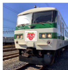
ヘッドマーク掲出イメージ