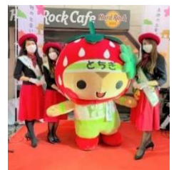
「本物の出会い 栃木」 観光キャラバン隊