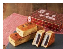
「東京レングァパン」 (東京あんぱん豆一豆)