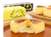
「チーズフォンデュケーキ」 (テラ・セゾン)