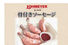
骨付きソーセージ