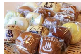
塩原温泉のおまんじゅう