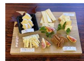
チーズ工房オリジナルチーズ