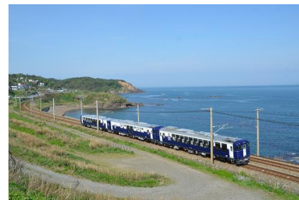
越乃 Shu * Kura