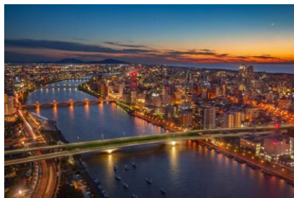
萬代橋と柳都大橋