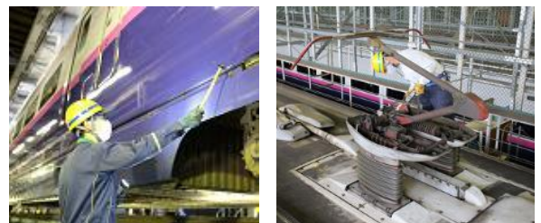
車両メンテナンスの様子