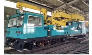
多機能電気保全車

架線の点検や工事に使用する保守用車両「多機能電気保全車」の展示および高所作業台を操作し実際の作業の解説を行います。