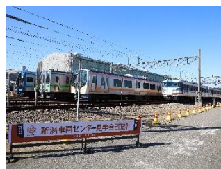
前年開催時の様子

会場への往復アクセスはE653系「しらゆき」編成にご乗車いただきます。往路では普段の営業運転では通れない回送線を経由し、車両センター内では「洗浄機」の通過をお楽しみください。復路は車両センター構内で進行方向を変えながら入換運転（転線）を行います。その後、「白上（はくじょう）」と呼ばれる白新線上りの線路に合流する出区車両専用的高架橋を通るルートを実演します。普段、見るることのできない車窓に流れる景色をご覧ください。