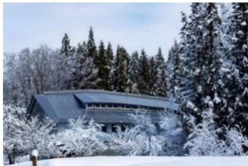
津南醸造株式会社