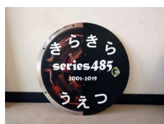
「きらきらうえつ」B （最低落札価格 20,000 円）