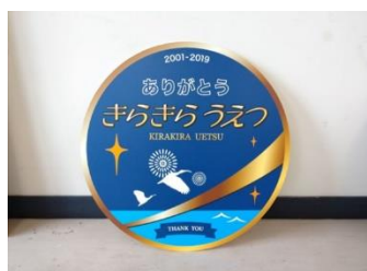
「きらきらうえつ」A （最低落札価格 20,000 円）