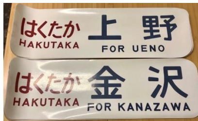
はくたか行先シール