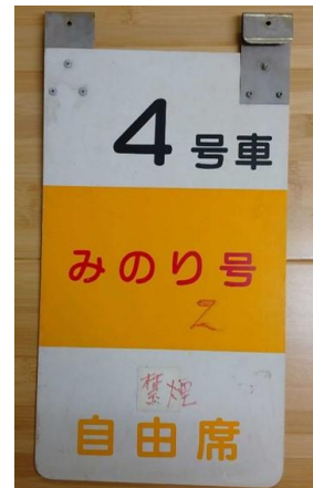
新潟駅乗車口案内板