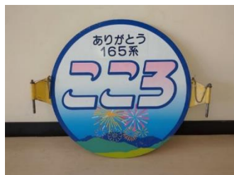
ありがとう 165 系「ココロ」 （最低落札価格 30,000 円）