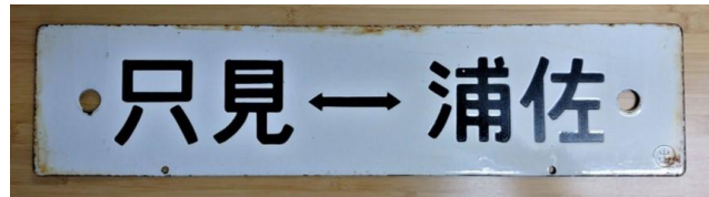
行先珪瑯表示板 (只見⇄浦佐) (最低落札価格 10,000 円)