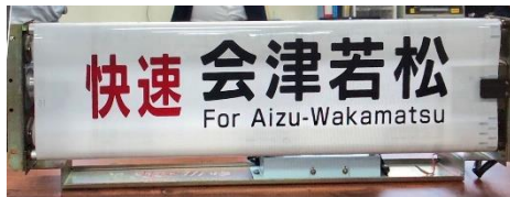
キハ 110 系幕式行先表示器