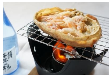
紅ズワイガニの甲羅焼き