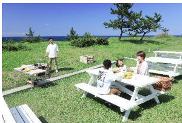
ガーデンバーベキュー

当館ではガーデンバーベキューはもちろんのこと、テニスコートでテニスやレンタル自転車でのサイクリング、近くの浅瀬で釣りなどのアクティビティを楽しむことができます。各種アクティビティに必要な道具はフロントにて貸し出しております。(一部有料)