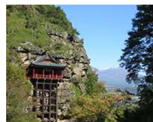
「小諸・布引観音コース」