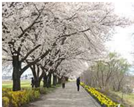
「中込・名所探訪コース」