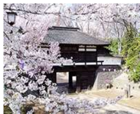
「小諸・懐古園コース」