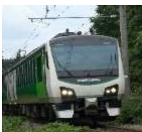
リゾートビューふるさと