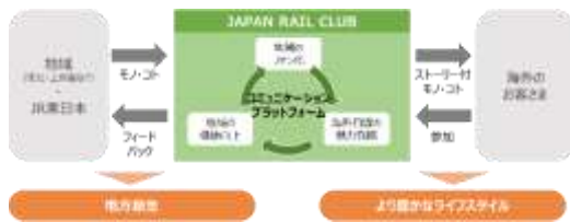
「JAPAN RAIL CLUB」コンセプト