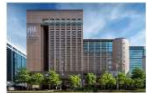
ホテルメトロポリタン プレミア 台北