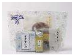
【小布施堂・旅する北信濃セット】