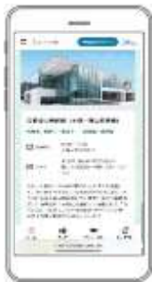
観光施設・交通機関・飲食店舗などを検索できます。