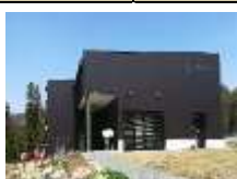
【信州たかやまワイナリー】