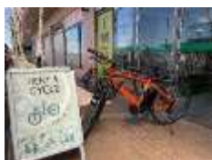
【信州須坂観光協会】 （レンタサイクル）