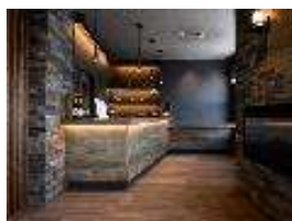
【THE ROOFTOP DINING】