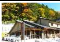
【信州高山村観光協会】 （レンタサイクル）