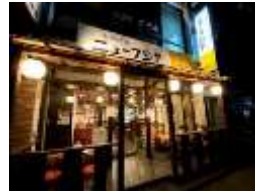
【大衆酒場ニューフジヤ】