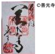
【善光寺御朱印（本堂）】