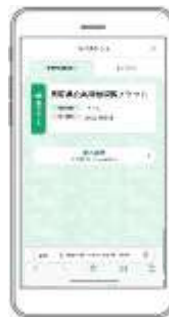
購入したチケットはマイチケット画面で確認できます。