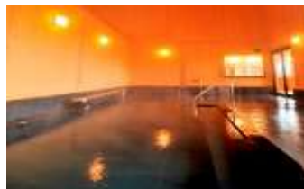
【ふるさとの湯・内湯】