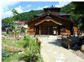
【ふるさとの湯・外観】