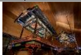
【北斎館・上町祭屋台、東町祭屋台】