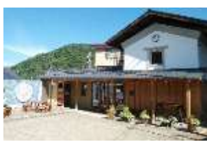
【L'Atelier KURA ラトリエ クラ】