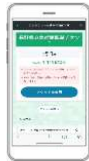
観光施設・交通機関ご利用の際「チケットを使用」をタップして表示された画面を係員にご提示ください。※電子チケットの一部、エキトマチチケットを利用の際は、店舗設置の宣伝物に表示されている6桁のPINコードの入力が必要となります。