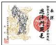
【米子不動尊・特別御朱印】 ※内容は変更になる場合があります