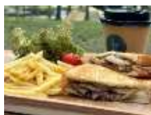
【nagano forest village 森の駅 Daizahoushi 鹿肉ホットサンド】