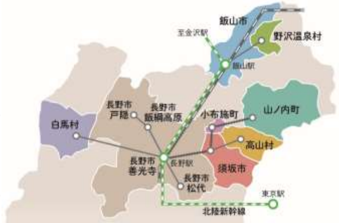
【交通電子チケット 利用エリアイメージ】