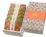
【栗庵風味堂・初栗詰合せ】