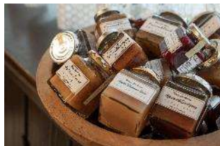
【ハウスサンアントンジャムファクトリー】