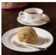
【桜井甘精堂・モンブラン紅茶セット】