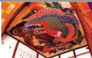
【岩松院・八方睨み鳳凰図】