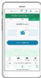
【電子チケットを購入】お支払いには「クレジットカード」または「モバイルSuica」が必要となります。※エキトマチチケットの購入には「JRE POINT」をご利用いただけます。