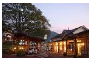
【湯田中駅前温泉 楓の湯】