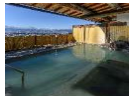
【小布施温泉 あけびの湯】